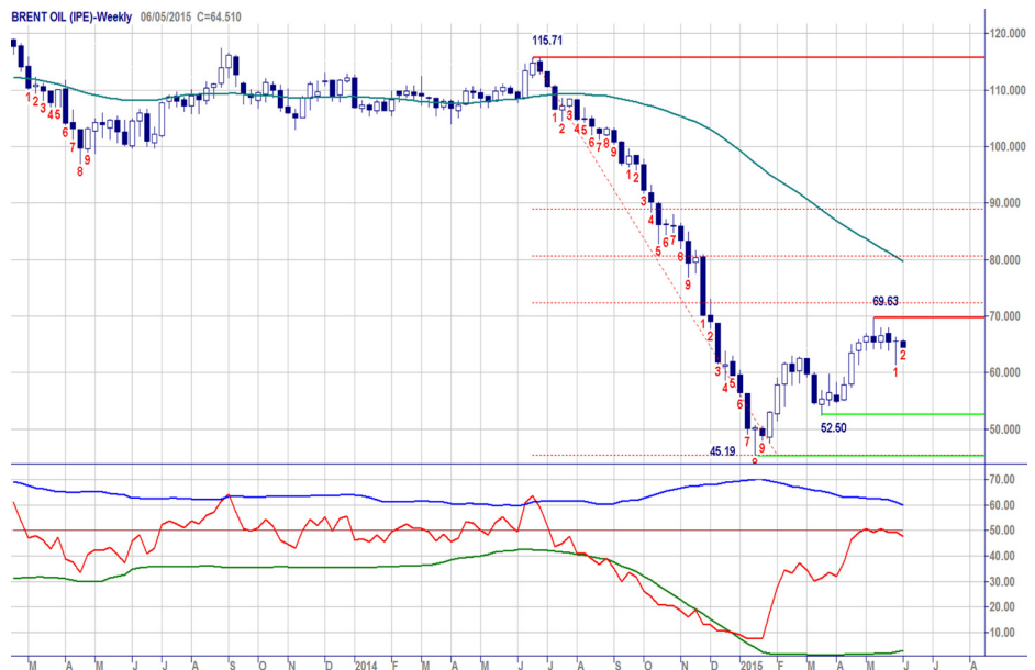
Weekgrafiek Brent Oil

Trendvolgende beleggers kunnen besluiten aan de shortkant in actie te komen. Zij volgen de swingteller met veel belangstelling.